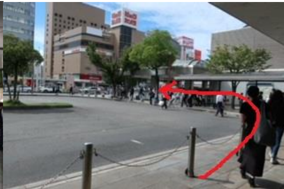
②ロータリーを左手に進みます