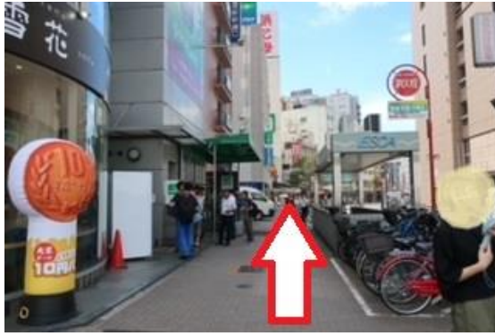
⑤そのまま真っすぐ進みます