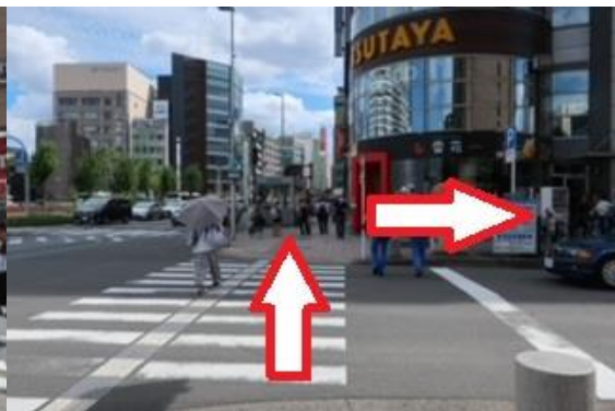
④渡り切ったら、左折しさらに横断歩道を渡り、右に進みます