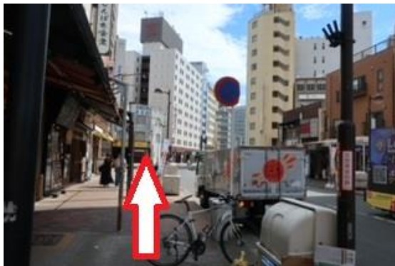
⑦そのまま真っすぐ進みます