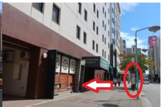
⑧交差点を一つ越えるとバス停が見えてきます

ホテルロビーを待合室としてご利用頂けますので、バス到着後乗務員がご案内に参りますまで、ロビー待合室にてごゆっくりお過ごしください(ホテルロビー待合室は 22:30~利用可能) 暑い中、寒い中、雨天時、夜遅い時間でも安心してバスをお待ちいただける空間となっております。