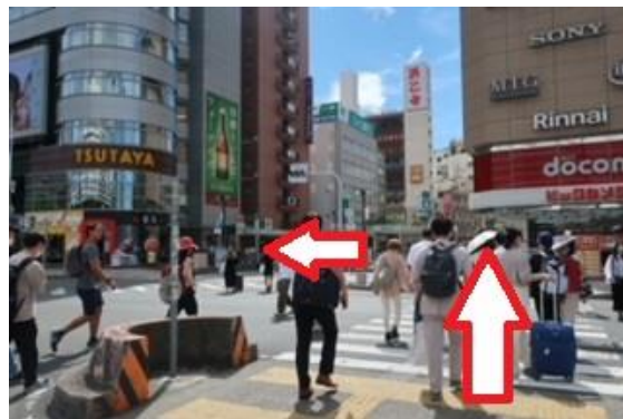
③ビックカメラ前の横断歩道を渡ります