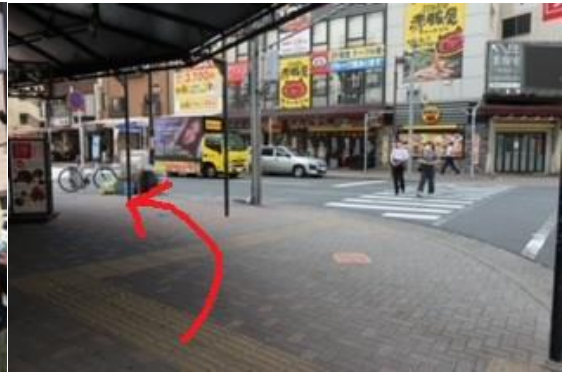
⑥一つ目の交差点を左折します