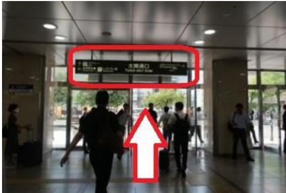
①JR 名古屋駅、太閤出口を出ます